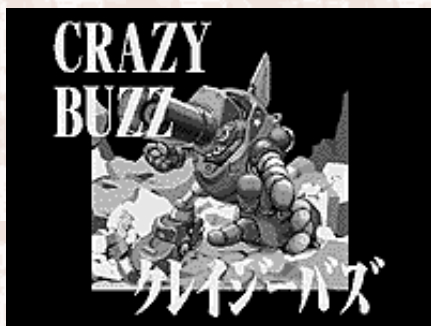
▲主人公、生きている大砲「クレイジーバズ」

だが、ガッテム将軍率いるライブマシンの精鋭たちがそれを阻止しようと総攻撃を仕掛けて来た!