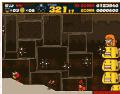
▲ ボスキャラは個性豊かなヤツばかりだぞ