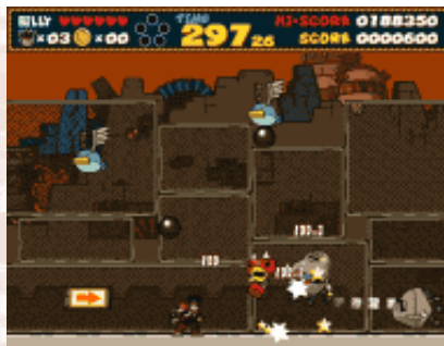
▲ 激しい攻撃にビリーもタジタジ !!