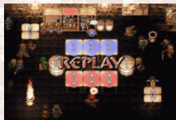
▲【写真4】リプレイ達成！これでもう1回スローイングができるぞ。