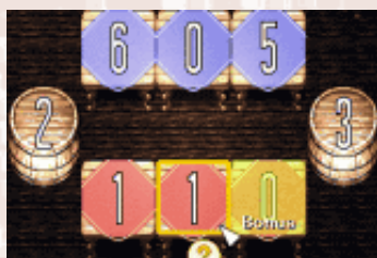
▲【写真5】最後に数字を足すフィールドが0で、向かい側が0以外の数字になっているよね。

重要なのは、「最後に数字を足すフィールド」は、自分のフィールドじゃなくてもいいってことだ(写真7)。敵のフィールドもうまく利用して、ボーナスを奪い取ってやるのだった！