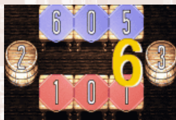
▲【写真6】これでボーナスを達成！ 5 + 1 = 6 ポイントが加算されたぞ！