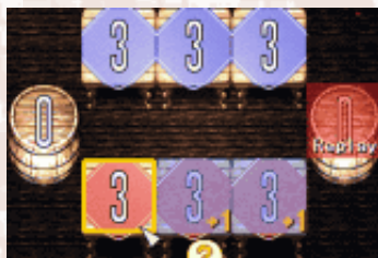
▲【写真3】最後に数字を足すフィールドが自分のホームになっている

「スローイング」で数字を足す最後のフィールドが自分の「ホーム」だった場合(写真3)、続けてスローイングが出来るというルールだよ。この「リプレイ」は、何度でも続けることが出来るので、ゲームを有利に進めるための重要な技だぞ。