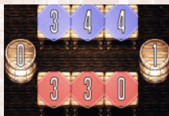
▲【写真2】実際にスローイングを行った結果がこれだ。