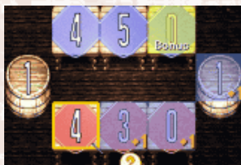
◀【写真7】相手のフィールドをうまく利用しよう。逆に、自分のフィールドも敵に利用される可能性があるぞ！！