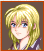
カシス・クオーダ

主人公・カシスの脇を固める登場人物たちはみんな個性豊かな人間ばかり！ 彼等の中で一体どんなドラマが展開するのか、想像するだけでも楽しみだ！