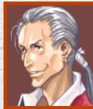
エスク・ガノブレード

小国クオーダの王子。宗主国である大国ラウルに、留学と称した人質として送られていた。父王の死後ラウルを脱出、新国王としてクオーダを継ぐ。